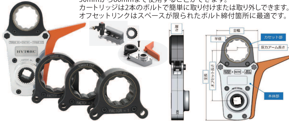
【 HYTORC オフセットリンク 型式・サイズ・製品寸法表 (本体・カセット部組付け時) 】

ハイトークオフセットリンクのカートリッジシステムはナット対辺30mmから80mmまで使用することができます。カートリッジは2本のボルトで簡単に取り付けまたは取り外しできます。オフセットリンクはスペースが限られたボルト締付箇所に最適です。